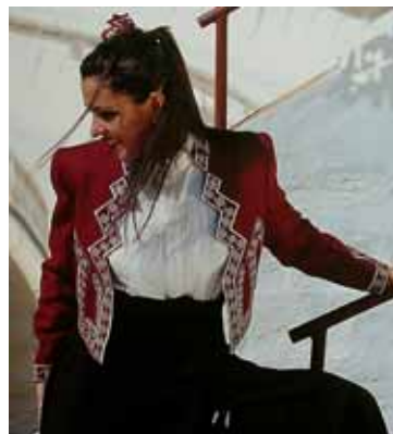
Ausführung in Weinrot/Silber